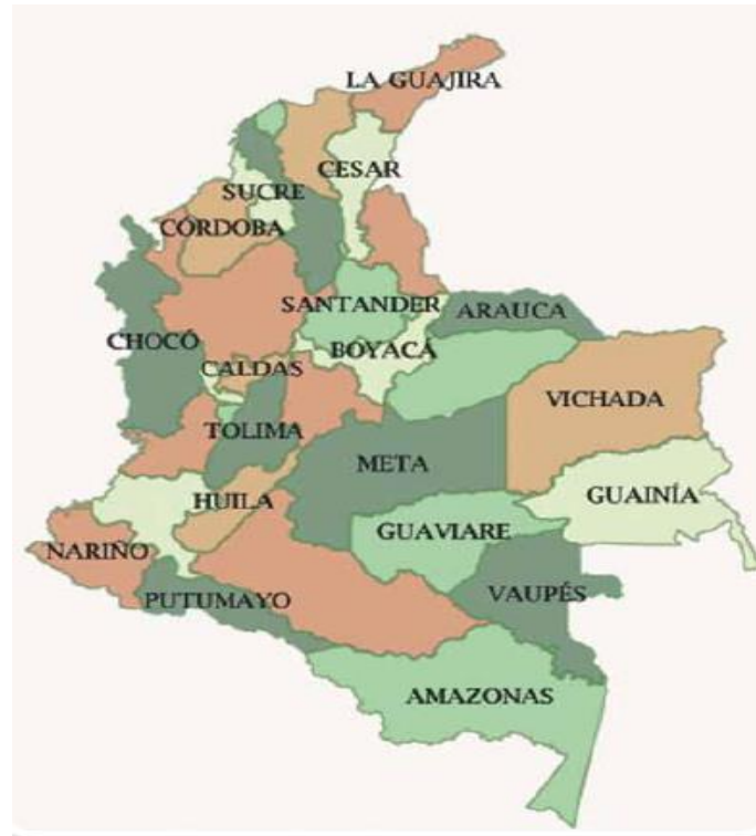
SI - GEO (Sistema de Información Geográfica del sector educativo) del Ministerio de Educación Nacional.